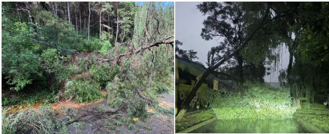
电缆铺设路径图及恶劣天气树木损坏线路图