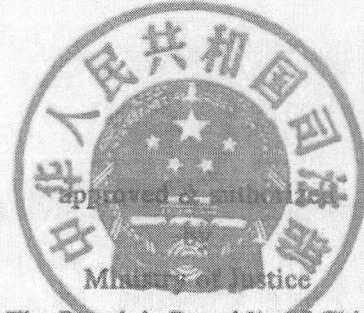
Ministry of Justice The People's Republic of China 编号: No. 0024841