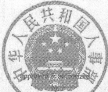
Ministry of Personnel The People's Republic of China

This is to certify that the bearer of the certificate has passed the uniform examination organized by the Chinese government authorities, and has gained required qualifications for Enterprise Legal Adviser.