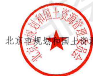
北京市规划和国土资源管理委员会