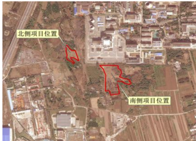
图1 拟建场地地理位置示意图

该项目场地位于房山区阎村镇北坊村西北，北京市房山区新镇中国原子能研究院西南侧，具体位置参见下图1《拟建场地地理位置示意图》。