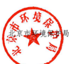
北京市环境保护局