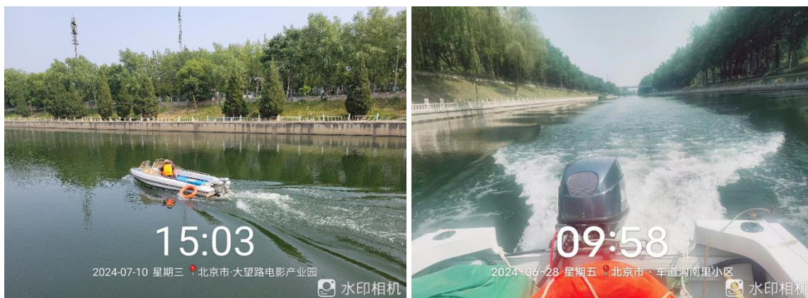
图 3 曝气船运行

船只可使用专用充电桩进行充电，西大望路平台下游以及永引渠玉渊潭进水闸均安装有船用充电桩可供曝气船充电使用。供应商应加装独立电表对船只用电情况进行计量，船只充电产生的电费由供应商自行承担。