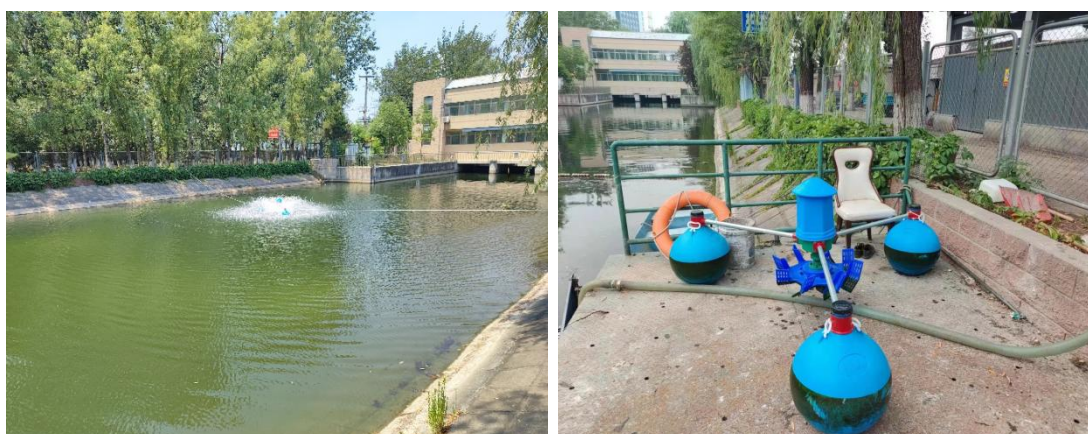
图 4 曝气机运行

每逢降雨过后，雨污水入河导致河道水体出现溶解氧降低的情况，严重时还会导致鱼类缺氧死亡，采用在问题水域安装漂浮式曝气机曝气充氧的应急方式，制造垂直循环流，加速表层及底层水体交换，有效提升水体溶解氧含量，强化水体自净能力。考虑到城市河道线长面广的特点，部分水域存在周边无法提供设备用电的问题，因此，曝气机选型上在传统用电曝气机外增加太阳能曝气机。结合 2024 年北京市降雨情况，2025 年计划使用 2 台曝气机（其中用电曝气机及太阳能曝气机各 1 台）开展曝气充氧工作共计 200 次（2 台曝气机各 100 次），单次运行时间为 5 个小时。