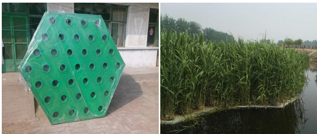
图 5 浮岛外形及浮岛植物效果

西蓄坡面绿化景观比较完整，砂石坑水上景观比较单薄，由于西蓄工程特点接收是雨洪水，因此水体富营养化程度高，有利于藻类生长，造成水质恶化。针对此情况，计划采用“多功能生态浮岛技术”对水体进行原位治理。利用高等水生植物，以浮床作为载体，种植到富营养化水体的水面，通过植物根部的吸收、吸附作用和物种竞争相克机理，削减富集水体中的氮、磷及有机物质，从而达到净化水质的效果，创造适宜多种生物生息繁衍的环境条件，在有限区域重建并修复水生态系统，并通过收获植物的方法将其搬离水体，使水质得到改善、水体变清、创建优美城市水环境的目标。