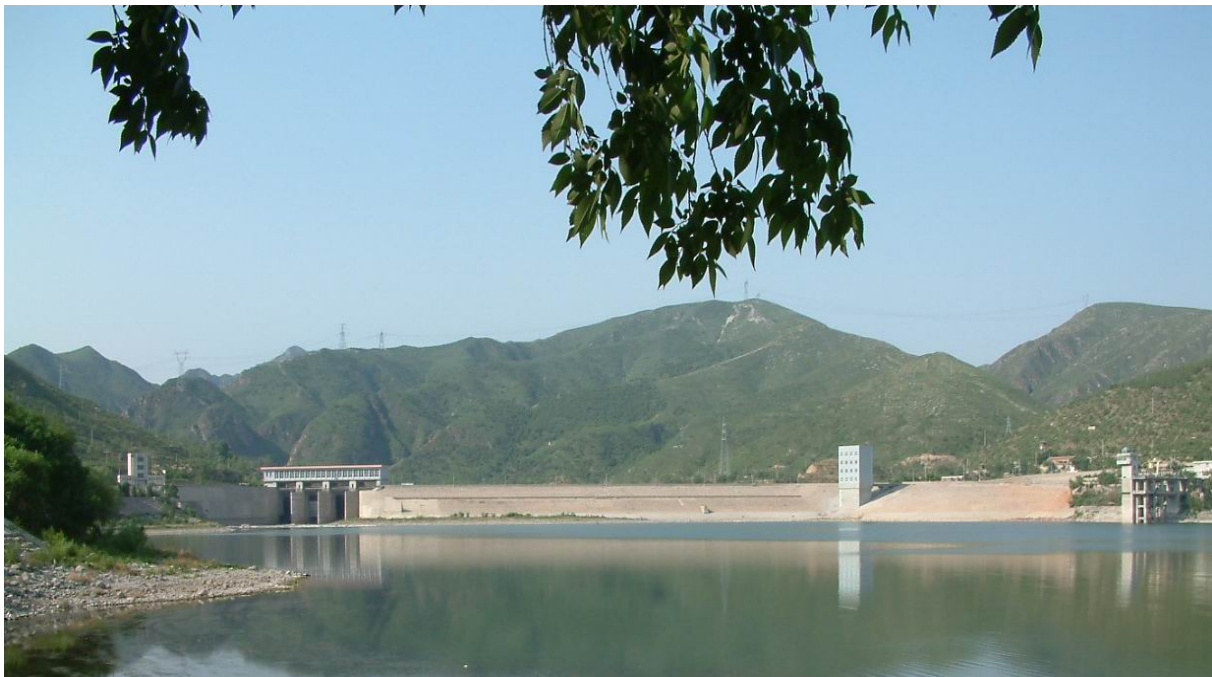
图 1-3 官厅水库枢纽工程

官厅水库为大(1)型综合利用水利枢纽, 工程等级为 I 等工程, 主要建筑由输水泄洪洞、拦河坝、溢洪道、水电站四部分组成, 均为 1 级建筑物。