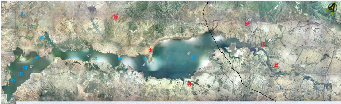
图 1-2 官厅水库库区影像图