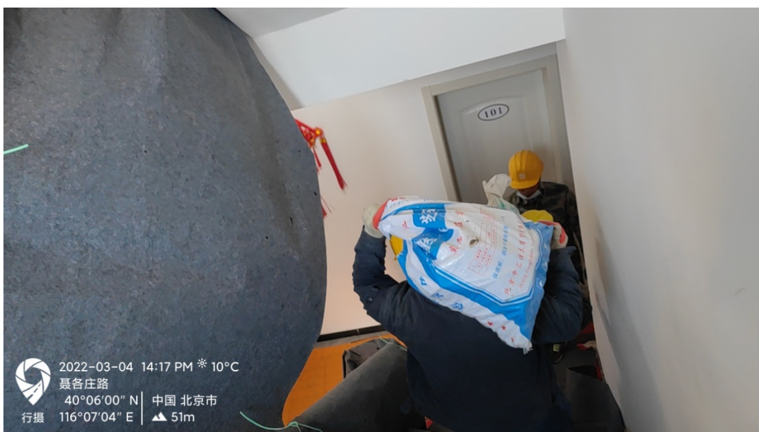
人工倒运楼顶渣土