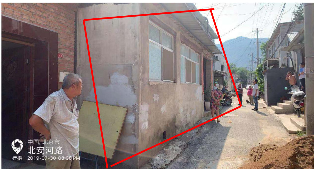
人居环境整治私搭乱建拆除点位示例

位工程量小。但是涉及到和保留房屋主体的结构安全，一般采用人工施工。根据现场胡同宽度，选择小型农用车倒运渣土或者直接进行渣土清运消纳。