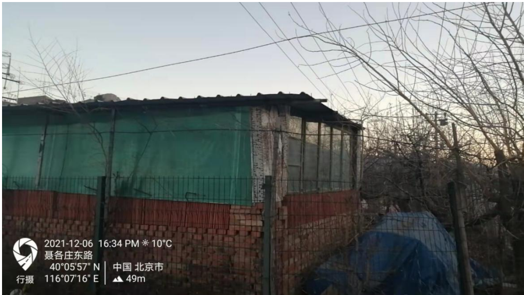
违法占地的棚子示例