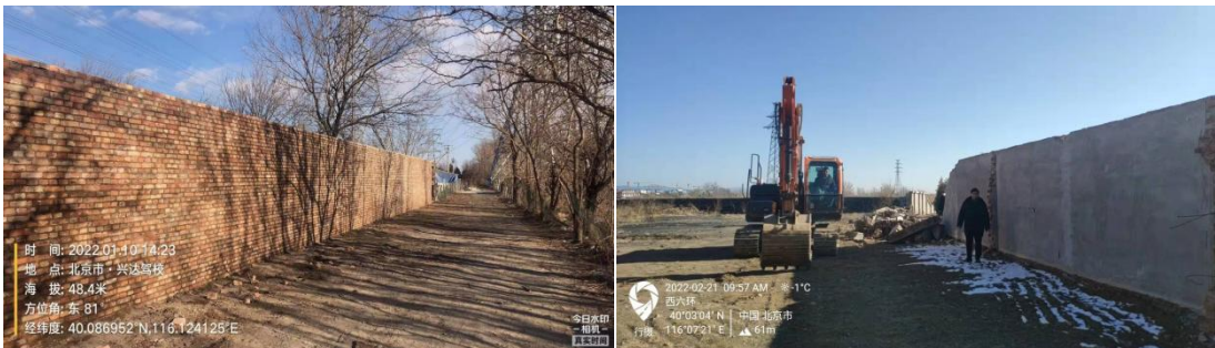
违章圈地墙体示例