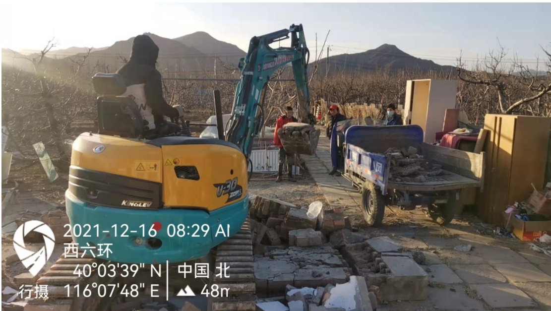
农用地房屋拆除、倒运现场渣土