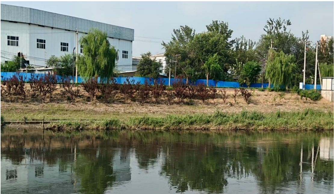
肖村桥上游左岸 50 米