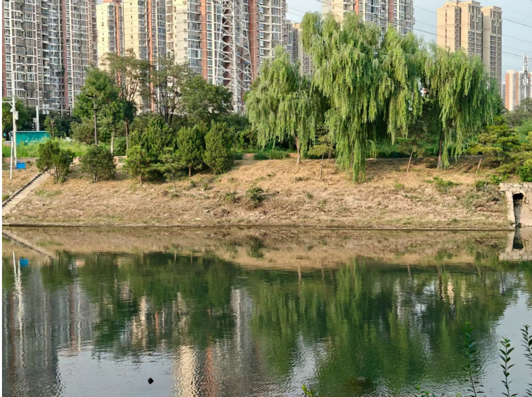
珊瑚桥上游左岸 50 米