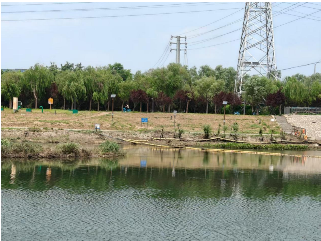
通久桥左岸上游 100 米