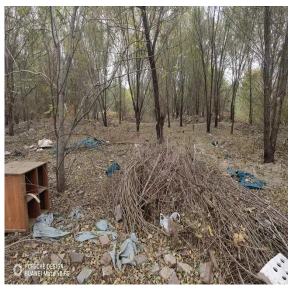
照片描述：局部垃圾