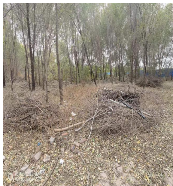
照片描述：杂树遍地、无绿化