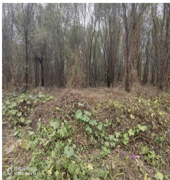
照片描述：杂草遍地、无绿化